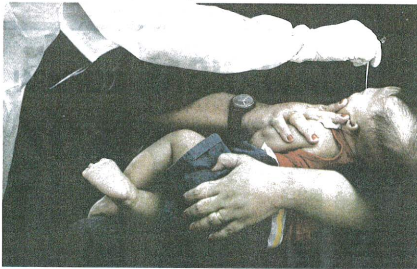
NEGARA mencatatkan 41 kematian akibat Covid-19 membabitkan individu berusia bawah 17 tahun sepanjang tahun ini. - GAMBAR HIASAN

"Jumlah kematian dalam kategori umur 7 hingga 12 tahun pula