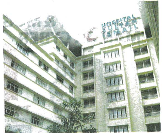
Di Hospital Sultan Ismail di Johor Bahru inilah seorang wanita bersalin secara bersendirian baru-baru ini.

Kelmarin, tular di media sosial mengenai seorang wanita yang mendakwa terpaksa melahirkan anak seorang diri di bilik pengasingan khas bagi ibu hamil yang positif Covid-19 setelah panggilan hospital tidak dilayan.