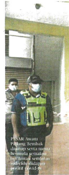
PASAR Awam Padang Tembak ditutup serta-merta bermula semalam berikutan sembilan individu didapati positif Covid-19

Bangkok: Thailand mula melonggarkan beberapa sekatan Covid-19 di Bangkok dan 28 wilayah berisiko tinggi bermula kelmarin berikutan jumlah kes baharu terus mencatatkan penurunan.