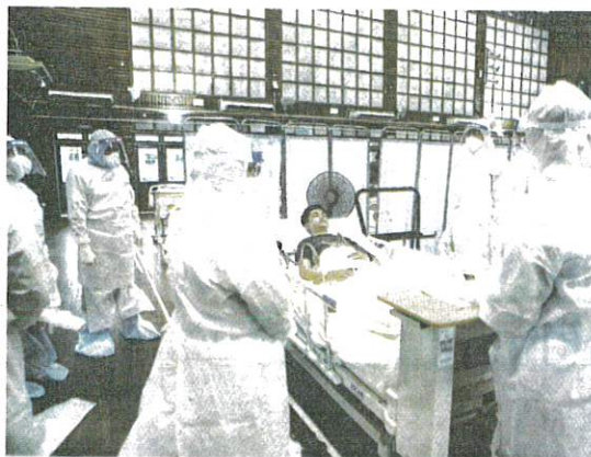
KEADAAN pesakit Covid-19 di PKRC lebih terjamin berikutan mempunyai pasukan perubatan memantau tahap kesihatan mereka. - GAMBAR HIASAN

Menurut Soon Hin, untuk makluman, hotel bertaraf empat bintang, Royale Chulan Penang, di sini akan menjadi PKRC