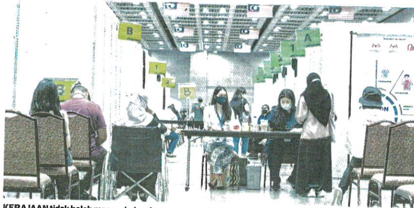
KERAJAAN tidak boleh menggubal undang-undang memaksa orang ramai mengambil vaksin Covid-19.

"Adalah lebih baik pendidikan diterapkan secara berterusan dalam kalangan rakyat bagi mewujudkan kesedaran. Malah dengan memberi kelonggaran kepada penerima dua dos untuk aktiviti fizikal dan sosial sudah